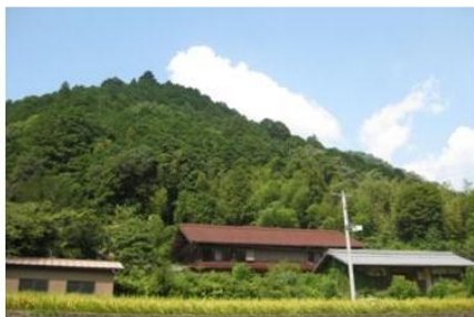
築200年の古民家 通称「おやしき」

家は、空き家も持ち主から購入しボランティアの協力も得て作業します。この空き家リフォーム塾は、各回1泊2日。移住希望者は、四季折々の串原を見てもらえるようになりました。我々も皆さんと同じ釜の飯を食べてみれば、その“人となり”が分かるのです。