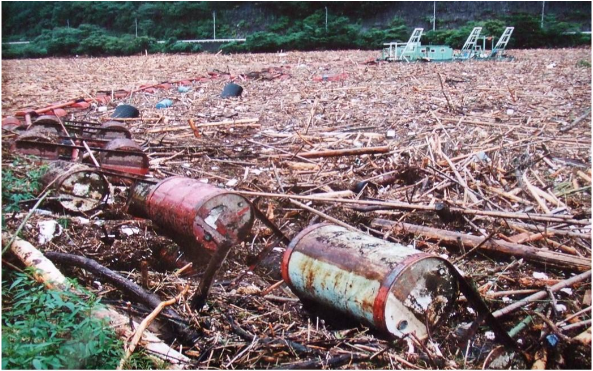
平成12年9月12日矢作ダムに流入した流木（約35,000m 3 ）

リフォーム作業は、素人では不安がありますので、塾生は地元のプロの大工さんに指導を仰ぎ、安全対策も含め、家を作るための基礎技術を習得しつつ古民家を自分の住む家として改修します。