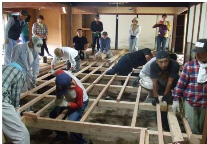
大引及び根太の取付